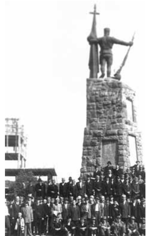
Краљевачки солунци, пре уклањања споменика 15. септембар 1958. године

Управа се у потпуности слаже са Вашим гледањем на ову ствар и налази да је за похвалу свака иницијатива која би довршење споменика привела крају.