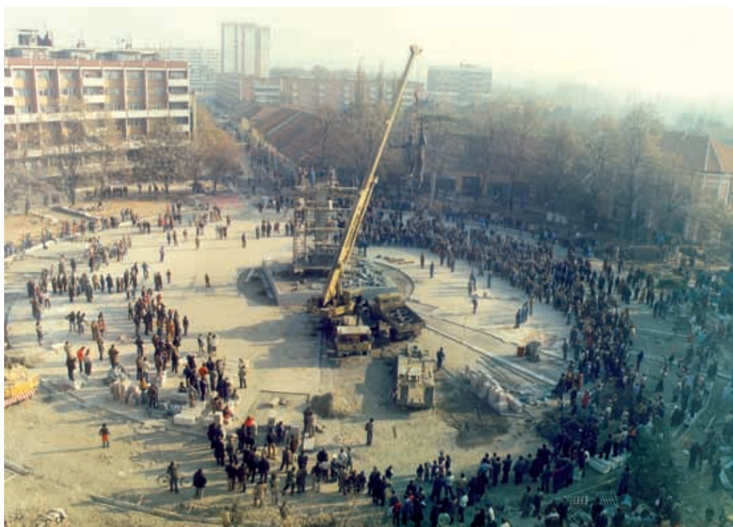
Дочек споменика на тргу 13. новембар 1982. године