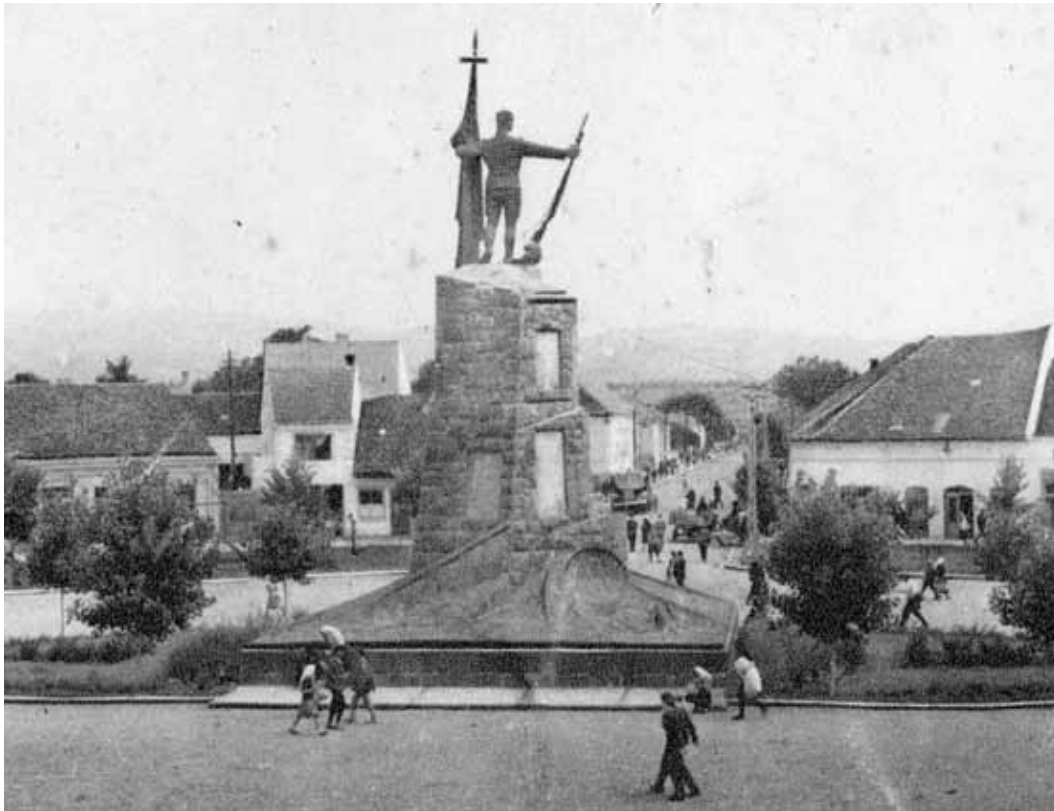
Ранковићево - Споменик палим борцима из Првог светског рата

ника већ странаца, који морају хтели или не хтели угледати недокончен споменик палим борцима.