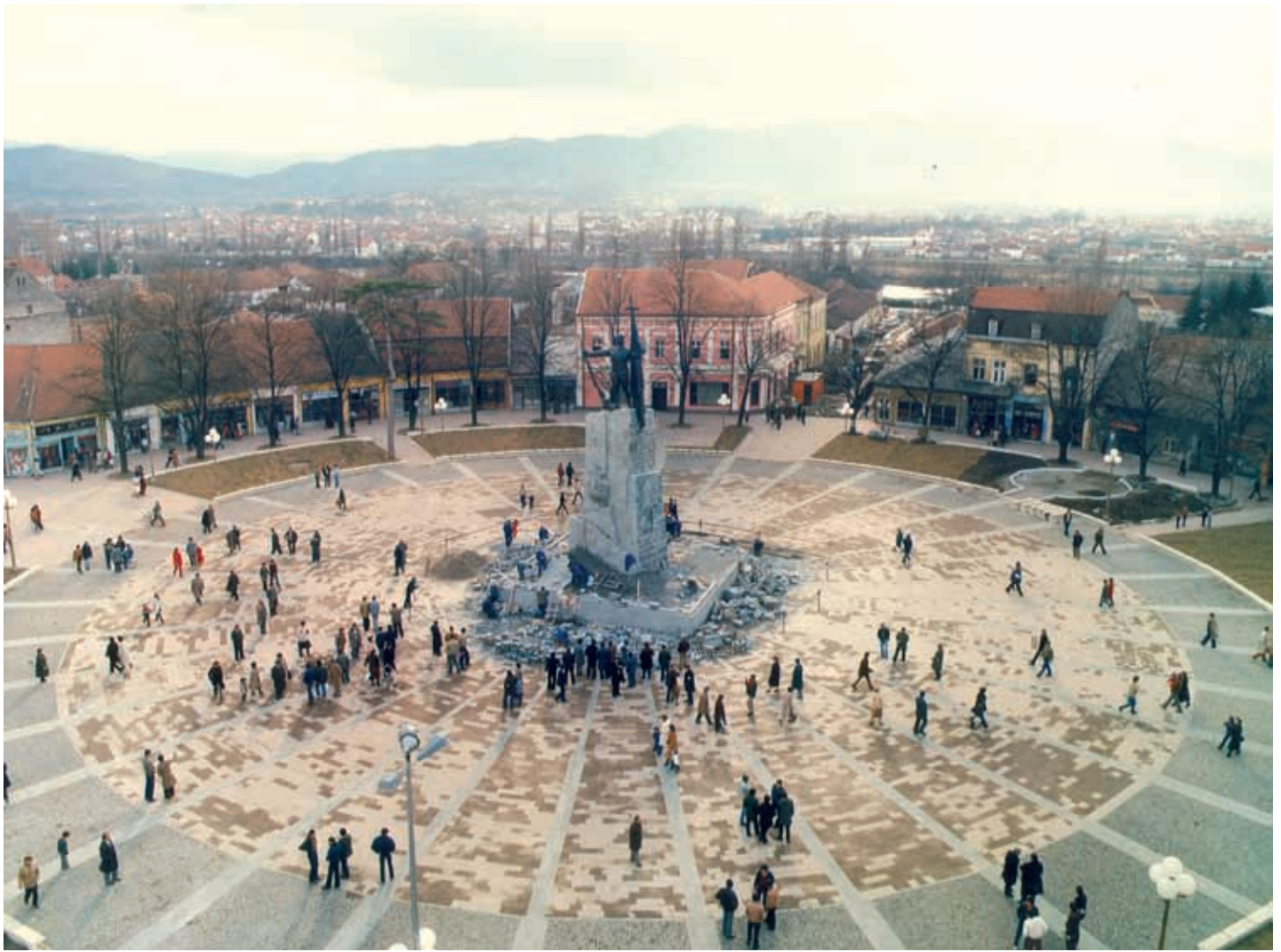
Споменик после враћања, 14 децембар 1982. године