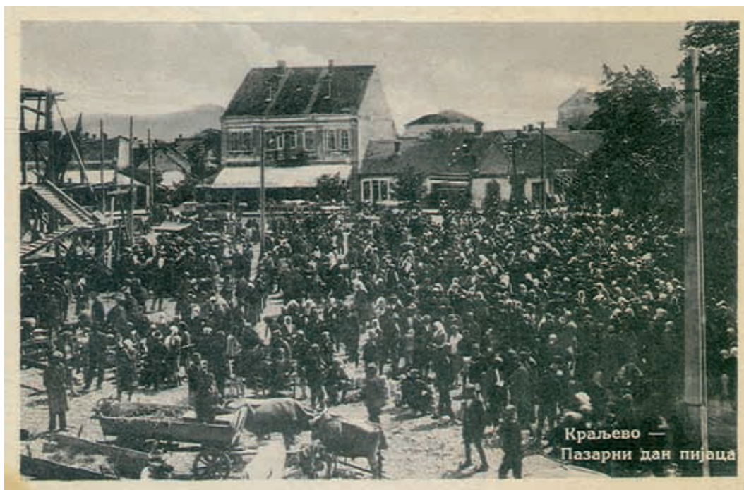
Краљево – пазарни дан, пијаца, Трг краља Александра, 1931. (са скелом приликом градње споменика)