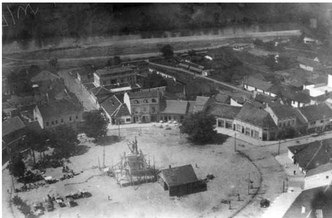
Краљево, авионски снимак 1933. год.

Примио сам Свелово писмо. Данас сам водио преговоре са једном приватном Фабриком, у којој раде исти мајстори, који су израдили наш споменик у Крагујевцу. О резултату ћу Вас известити. У исто време поново ћу покренути ово питање и код Министарства Војске.