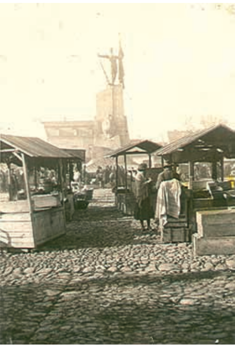
Трг краља Александра 1937.