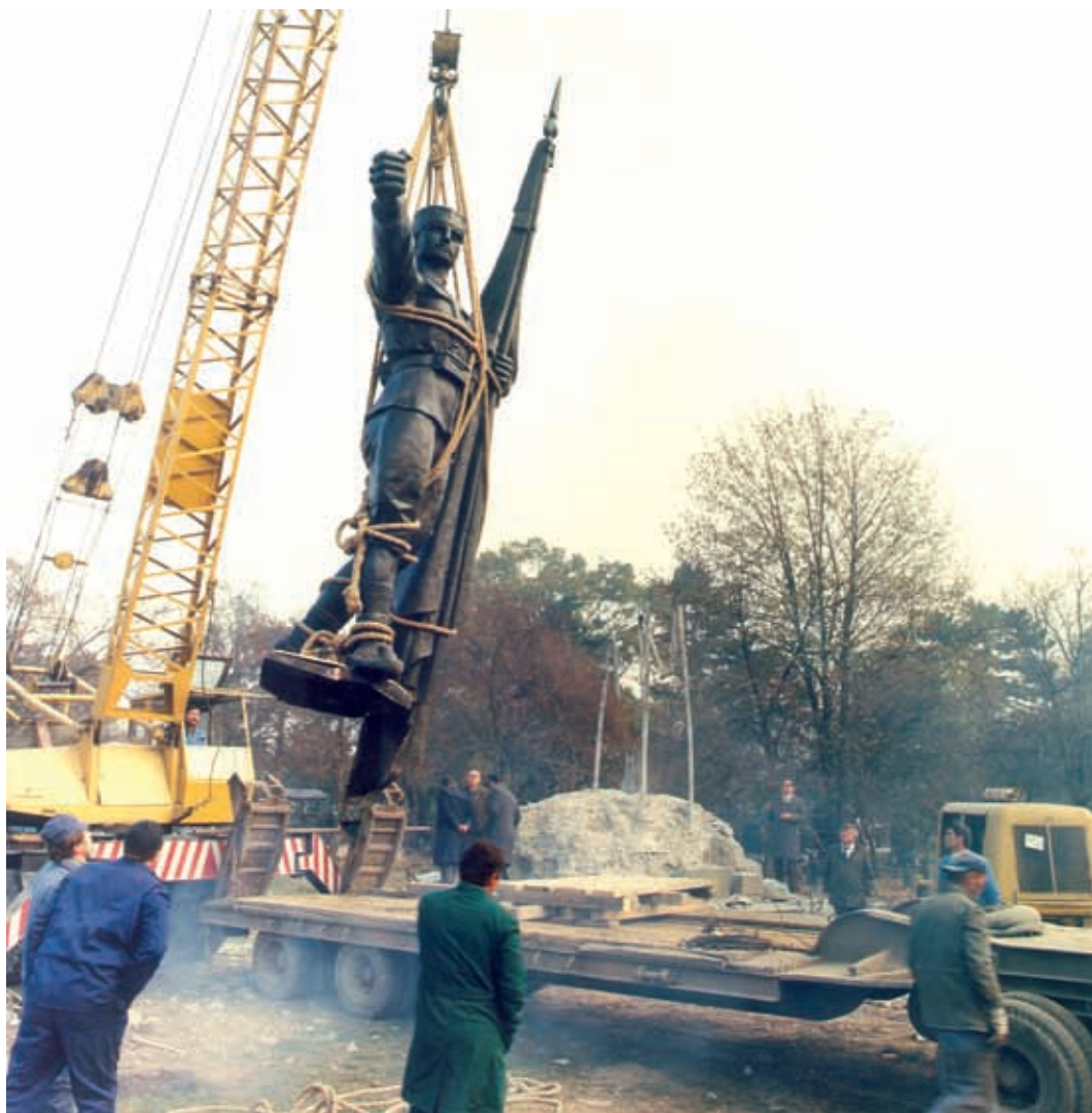
Утовар споменика за нову вожњу 13. новембар 1982. године