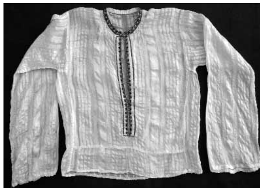
Сл. 15 Кошуља са ошвицом , Црна Гора, поче- так XX века, инв. бр. 930