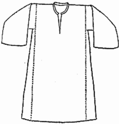
Сл. 1. Женска кошуља динарски тип, XIX век

Кошуља динарског типа ношена је у највећем делу Србије. Дугачка је, право кројена, са уметнутим клиновима – троугластим комадима платна којима се кошуља у доњем делу проширује, рукавима пришивеним за сџан – основу за коју се пришивају клинови, приклинци, рукави и ојлећак – четвртасти комад платна пришивен на грудима за сџан . (сл. 1). У Посавини, Подунављу и Војводини кошуља је панонског типа. Дугачка је, широка и око врата богато набрана (сл. 2). Мушка кошуља је у свим деловима Србије готово иста, дугачка, право кројена, типа тунике са рукавима (сл. 3).