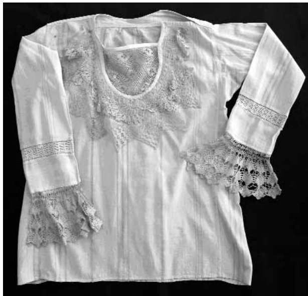
Сл. 11 Женска кошуља око 1930, 6 инв. бр. Е-55

На формирање шумадијске народне ношње утиче и одећа досељеника. Она се прилагођава одећи староседелаца, а њихови елементи се мешају и прожимају. Музеј у Краљеву чува кошуље из Доње Груже динарског типа које до краја друге деценије XX века нису претрпеле значајније промене. Израђене су од конопљаног, ланеног, памучног, а за празничне дане од свиленог платна. 7 Досежу до испод колена, дугих су и равно кројених рукава (сл. 12). Богато су украшене везом и чипком око врата и доње ивице рукава. После 1925. године кошуља је знатно краћа и ношена је уз подсукњу од истог материјала (сл. 13). Кројне одлике су углавном непромењене. Мушка свакодневна кошуља почетком XX века је од конопљане, а празнична од памучне или полусвилене тканине. По кројним одликама одговара онима фабричке израде и нема везених украса.