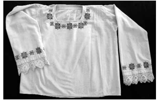
Сл. 13 Кратка женска кошуља Доња Груза, после 1925, инв. бр. Е-59

Важан део црногорске народне ношње до средине XX века су кошуље са ошвицом . У краљевачком музеју сачуване кошуље овог типа су од свилене тканине с једнобојним пругастим дезеном (сл. 14). Кратке су, равне и са дугим и право кројеним рукавима. Дискретним везом од разнобојног свиленог конца и срмених нити, украшене су око дубоког изреза на грудима и око врата. Златне ошвице красе невестинске кошуље од танког, свиленог платна протканог срменим нитима. 8