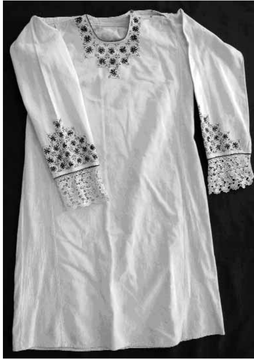
Сл. 12 Женска кошуља Доња Груза, XX век, инв. бр. Е-98