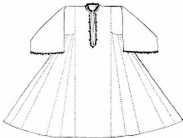
Сл. 6 Невестинска кошуља, XIX век

У Етнолошкој збирци Музеја у Краљеву најбројније су кошуље из Сјенице, Штавице, Рашке и Новог Пазара. Кошуље из околине Краљева и Врњачке Бање сличних су карактеристика и обрађене су у истој групи. 4