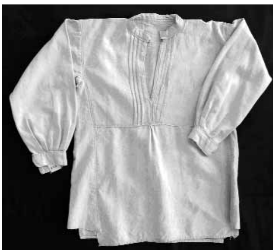
Сл. 7 Мушка кошуља, почетак XX века, инв. бр. Е-436

До првих деценија XX века, мушка и женска кошуља коју је носило становништво у поменутиим областима Србије, припада врсти право кројене тунике са рукавима. Украшена је везом око врата, на грудима и око доње ивице рукава (сл. 10). Вез је често допуњен чипком и тракама домаће или фабричке израде (сл. 9). Посматрано по областима, разлике су се односиле на ширину, дужину, начин ношења. Свакодневне кошуље су од конопљаног (сл. 7.), а празничне од памучног или платна са узводима , односно платна са једнобојним пругастим дезеном (сл. 11). Временом се мушка и женска кошуља скраћују и носе уз чакшире и сукњу зими, а лети уз гаће и подсукњу. Летњи доњи делови одеће су углавном од платна исте врсте. Приметна је и редукција везених украса. 5 После Другог светског рата није било довољно фабричких тканина и настављено је са употребом домаћег платна. Крој кошуље одговара онима конфекцијске израде (сл. 8).