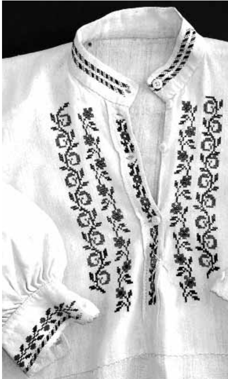
Сл. 4 Кошуља украшена памучним концем, инв. бр. Е-72