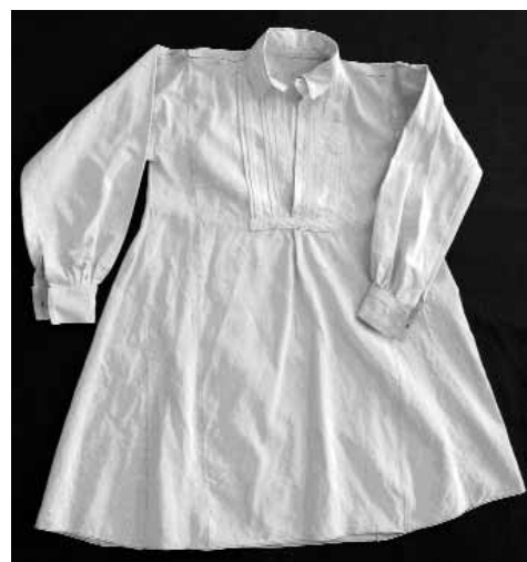
Сл. 8 Мушка кошуља, XX век, инв. бр. Е-1422