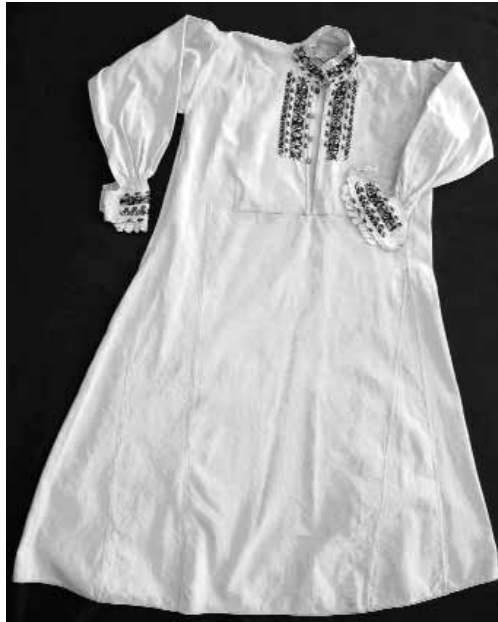
Сл. 10 Женска кошуља почетак XX века, инв. бр. Е-449