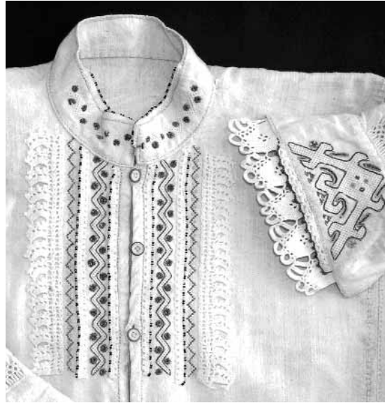
Сл. 5 Кошуља украшена везом од памучног конца, металних и свилених нити, перлама и шљокицама, инв. бр. Е-128

Ибра у Западну Мораву с југа и реке Груже са севера. Долине ових река природне су раскрснице миграционих кретања. Од давнина, становништво је упућено на међусобне утицаје и додире са суседним антропогеографским целинама. Положај и стална кретања условили су да Краљево и околина, буду етапна станица досељеницима из Новог Пазара, Горњег Ибра, Колашина, Васојевића и Старог Влаха, при њиховом насељавању дубље у Србију. Многи су остали, на овим просторима и са собом донели творевине материјалне и духовне културе матичног краја. 3