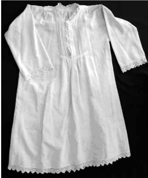
Сл. 9 Женска кошуља почетак XX века, инв. бр. Е-982